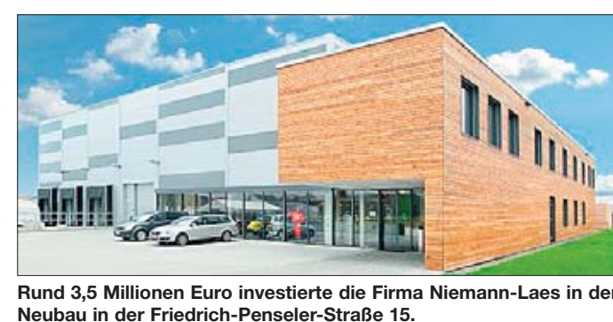
Rund 3,5 Millionen Euro investierte die Firma Niemann-Laes in den Neubau in der Friedrich-Penseler-Straße 15.

Lüneburg. Zur Einweihung des neuen Standortes der Firma Industriebedarf Niemann-Laes GmbH findet in der Friedrich-Penseler-Straße 15 in Lüneburg, am Freitag, den 13. Mai, 9 bis 17 Uhr, und Sonnabend, den 14. Mai, 10 bis 16 Uhr, die erste Hausmesse statt. An beiden Tagen werden gemeinsam mit den Top-Partnern der neue Standort, aber auch Produktneuheiten und der dazugehörigen Dienstleistungen vorgestellt. Zu den beeindruckenden Messeaktionen gehören unter anderem die Montage und Demontage von